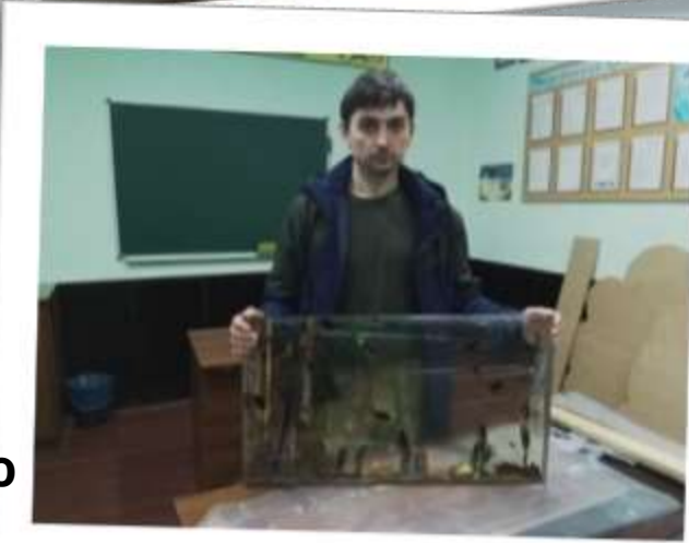
Виготовлено епоксидний акваріум для краєзнавчого музею