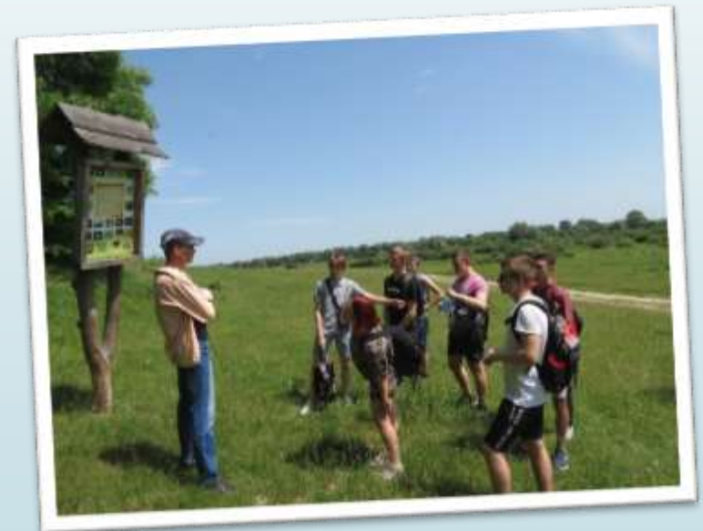
Екскурсія в Мезинський національний природний парк