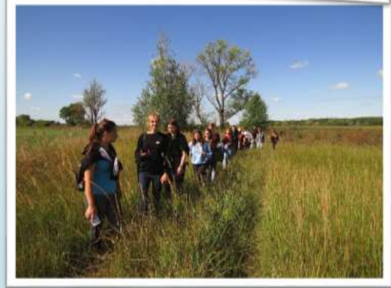
Екскурсії екосистемами Ніжинського району