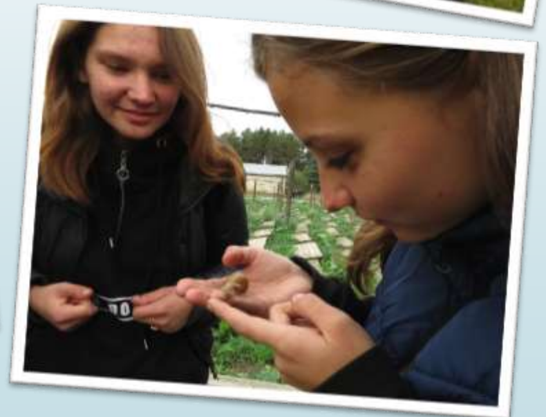
Екскурсії в Міжрічинський регіональний ландшафтний парк