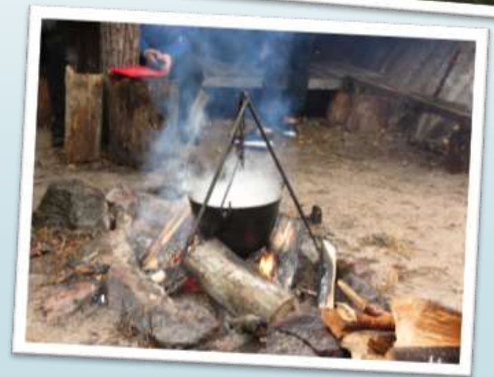
Екскурсії в Міжрічинський регіональний ландшафтний парк