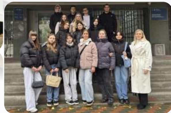
Ніжинська об'єднана державна податкова інспекція