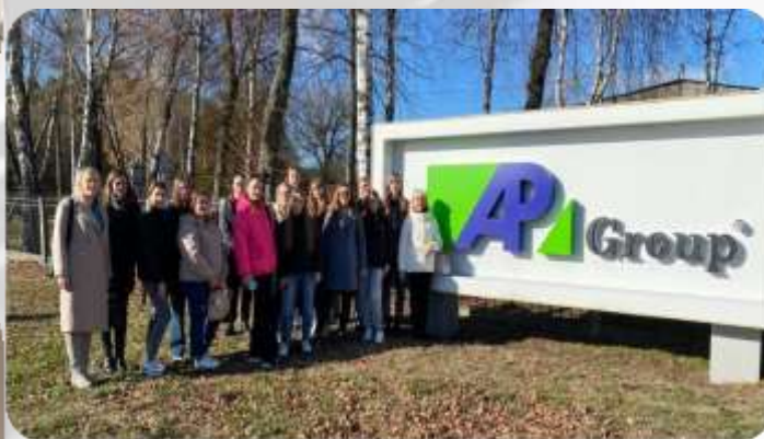
ТОВ «Ніжин Агро»